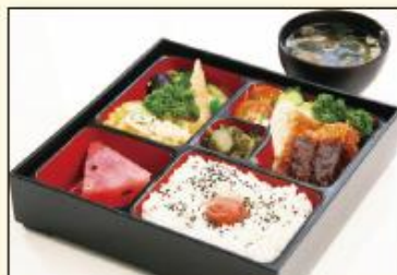
●湯治部夕食(弁当膳) ※日帰り食事付も弁当膳になります。