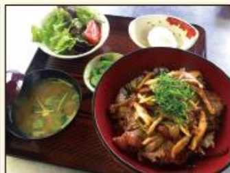
●レストラン「こまくさ」 人気メニュー ステーキ丼……1,200円 営業時間/11時30分~13時30分